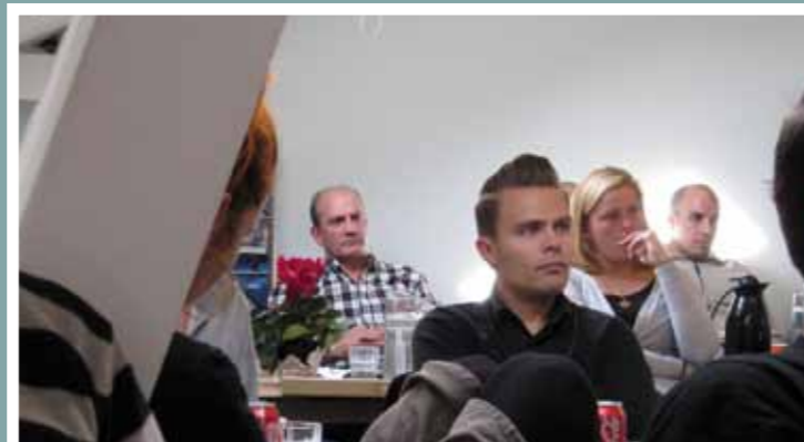
Lorem Ipsum something

D. 3. december handler om året der gik. På den dag vil vi se tilbage. Hvad har vi lært? Hvilke erfaringer har vi gjort os? Og hvad skal vi medregne i det nye år? Måske ved vi allerede her, hvilke nye udfordringer der er til den tid. Denne dag skal særligt bruges til at indhente inspiration og gode idéer til planlægningen af projektaktiviteter og uddannelsesprogram 2011. Og dagen afsluttes med en Julefest for alle medarbejdere! Kryds i kalenderen!