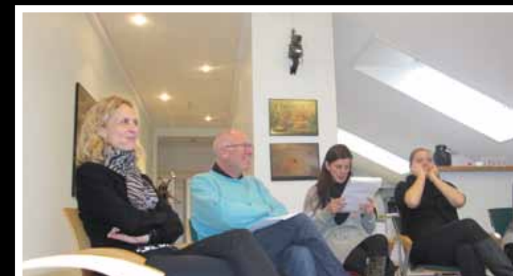
Dialoggruppe i Praxis Research

Der udvikles to praksis research forløb i 2010, hvor medarbejdere inviteres til at undersøge, analysere, konkludere og formidle, områder af egen praksis. Vi forventer at foretage praksis research forløb i marts/april/maj og igen i september/oktober/november. I vil hører nærmere om dette.