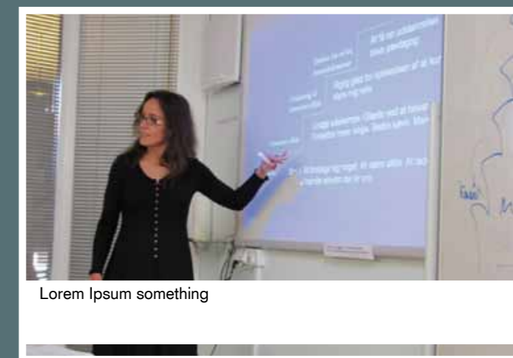
Lorem Ipsum something